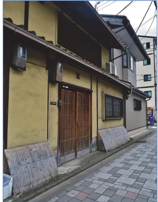
写真 4.4 京都・町家の竹製犬矢来 (通気性を確保しつつ雨水跳ね返りを抑制)