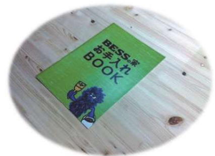
写真 4.5 住まいのお手入れガイド例

これらは、住まい方に関わる問題なので設計者といえども施主に押し付けはできない。しかし、 お奨め はできる。「住まいのお手入れガイド」等の資料を用意して啓発活動を行うことは、設計・施工者の大切な役割といえよう（写真 4.5）。