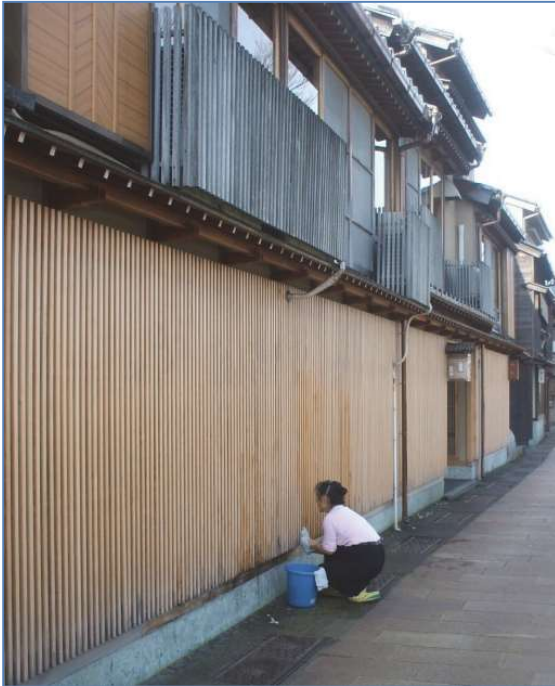
写真 4.3 無塗装材の吹き掃除の様子 (オーナー自ら雨後に拭き掃除をしている)

この部位の保護対策として京町屋では竹製の「犬矢来」が設置されている（写真 4.4）。先人の知恵というべきであろう。