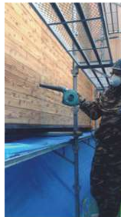
既存塗膜の粉末除去